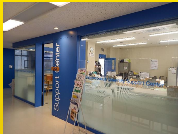
江別キャンパス: サポートセンター