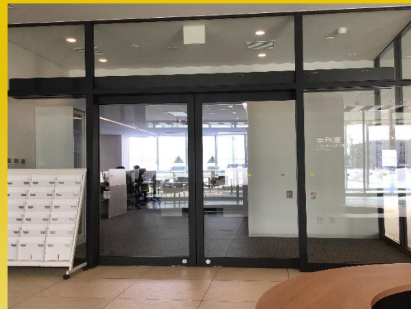
新札幌キャンパス: 学生支援課