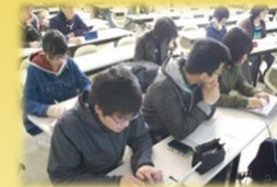
授業でのパソコンテイク

本学の障がい学生支援の始まりは学生達が自主的に立ち上げたバリアフリー委員会でした。その後、教職員組織としてのアクセシビリティ推進委員会が設置され、現在に至っています。学生同士の相互扶助、成長の気風は受け継がれ、障がいのある学生への情報保障、通学介助などの必要な支援等に直接関わっているのは、多くの在学学生たちです。テイク技術を学ぶための講習会、介助の講習会、手話の勉強会なども行います。初めての方でも技術を身につける機会はたくさんあります。支援活動を行うと、大学で定める謝金が支給されます。サポートセンターでは、支援学生（アクセシビリティ・学生スタッフ）を随時募集しています。