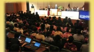
大学行事でのパソコンテイク

本学の障がいのある学生への支援内容などについては、以下のWebサイトをご覧ください。